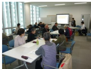
地域活動交流会の様子

しています。活動資金となる助成金の相談、活動団体の交流・情報交換のための団体交流会の開催、情報誌「かだる」の発行、セミナーの開催、ホームページからの情報提供など様々な事業を行っています。地域での社会参加に意欲を持つ高齢者の皆さんのご利用をお待ちしています。